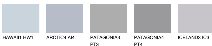
HAWAII1 HW1 ARCTIC4 AI4 PATAGONIA3 PT3 PATAGONIA4 PT4 ICELAND3 IC3