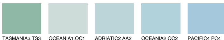
TASMANIA3 TS3 OCEANIA1 OC1 ADRIATIC2 AA2 OCEANIA2 OC2 PACIFIC4 PC4