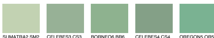
SUMATRA2 SM2 CELEBES3 CS3 BORNEO6 BR6 CELEBES4 CS4 OREGON5 OR5