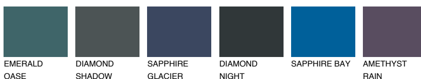
EMERALD OASE DIAMOND SHADOW SAPPHIRE GLACIER DIAMOND NIGHT SAPPHIRE BAY AMETHYST RAIN

Więcej informacji o tynkach i farbach na stronie